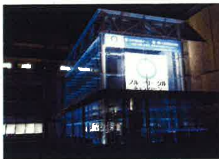
「世界糖尿病デー」「全国糖尿病週間」