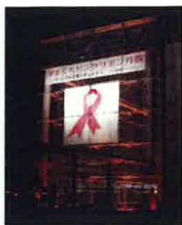
「やまぐちピンクリボン月間」