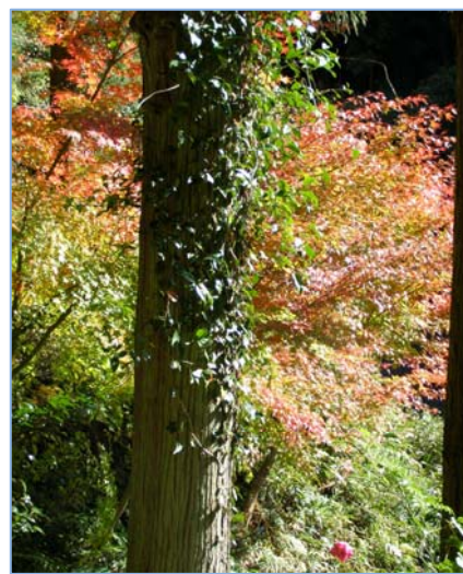
← 木に囲まれたトンネルのようでした。行く先が見えないところが、またドキドキ感を増します。