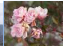
梅の木のつぼみがふくらんでいました。