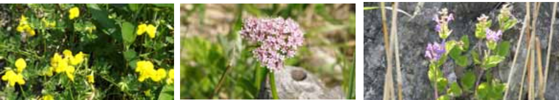
セイヨウミヤコグサ