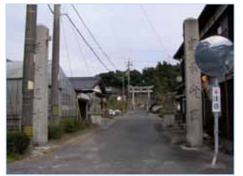
東荷神社です。参道をすすんでいくと、目の前にかんりの段数の階段が待ち構えていました。