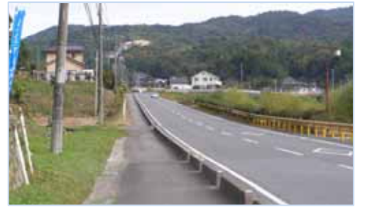
交差点に到着しました。

そばに「一里塚」と思われる石の標識があります。風雨にさらされ、かなり字が薄くなって見えにくいのですが、「東 田布施へ二里半 柳井へ四里 岩國へ七里」の字が読めました。