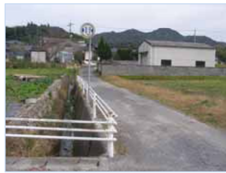
神社へはこの白いガードレールを目印に左へまがります。