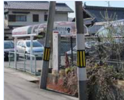
曲がり角の目印は製菓店です。右手前方の2本つらな電柱のそばに、入り口を示す看板が見えます。