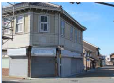
歴史を感じさせる通りです。