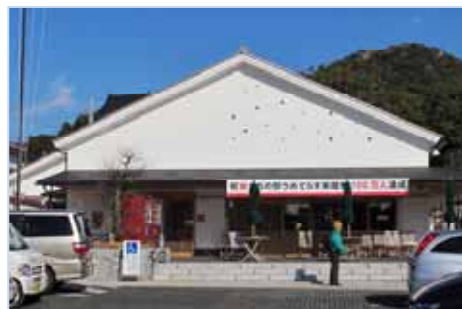
観光の拠点 うめてらす