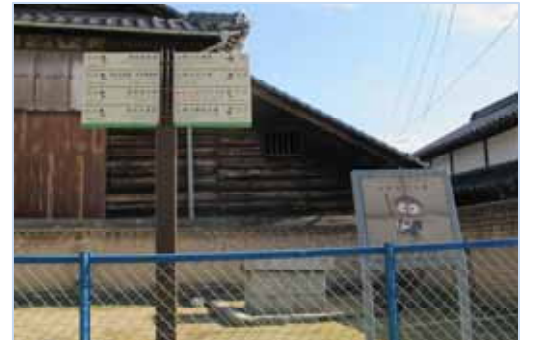
小径の入り口には、可愛い山頭火のイラストが。