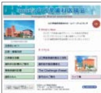
山口県歯科医師会ホームページ http://www.ygda.or.jp/